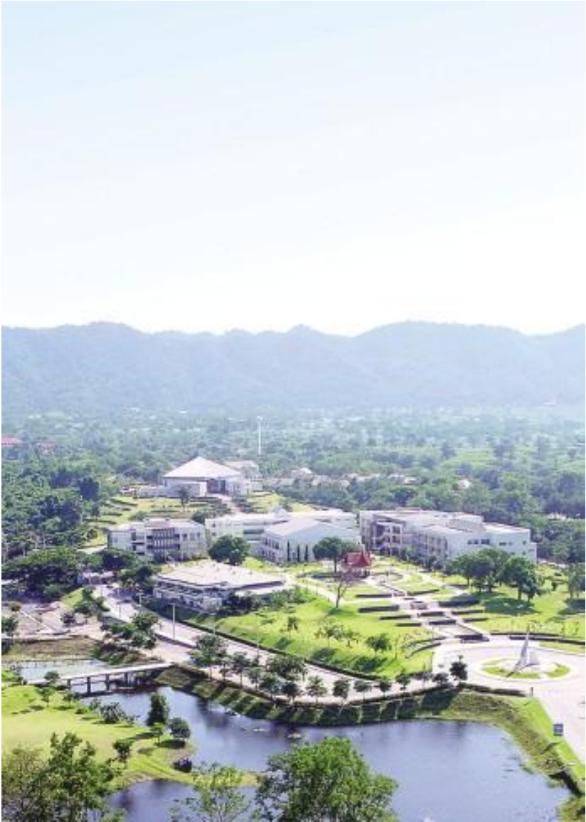
3 คู่มือนักศึกษา มหาวิทยาลัยนานาชาติเอเชีย-แปซิฟิก